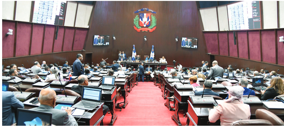
Los diputados declararon el proyecto de urgencia. F.E.

ELECTORAL. En medio de intensos debates encabezados por legisladores del Partido de la Liberación Dominicana (PLD), la Cámara de Diputados declaró de urgencia, aprobó en dos sesiones consecutivas y convirtió en ley el proyecto de reforma a la Ley Orgánica de Régimen Electoral (Ley 15-19) sancionado en el Senado.